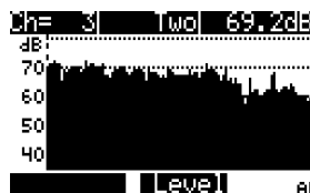
Balayage complet de tous les canaux