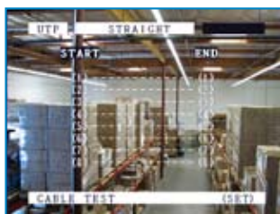
Schéma de câblage sur liens réseaux RJ45 UTP.

Analyseur de protocoles , exploitable en ligne pour détecter les problèmes des caméras et des contrôleurs.